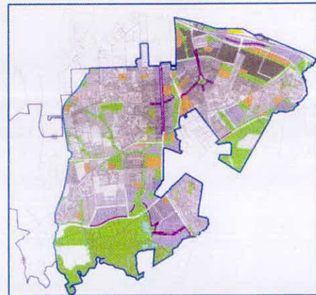
נספח 2: תבנית הבנייה

להלן תיאור תכולת כל תשריט/נספח ופירוט הפרק הרלוונטי אליו במסמכי התכנית: