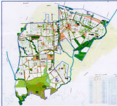
נספח 3: נוף ושימור אתרים ומתחמים